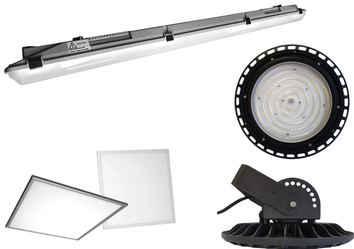
(Фиг.3) Продукти произведени от Електростарт АД